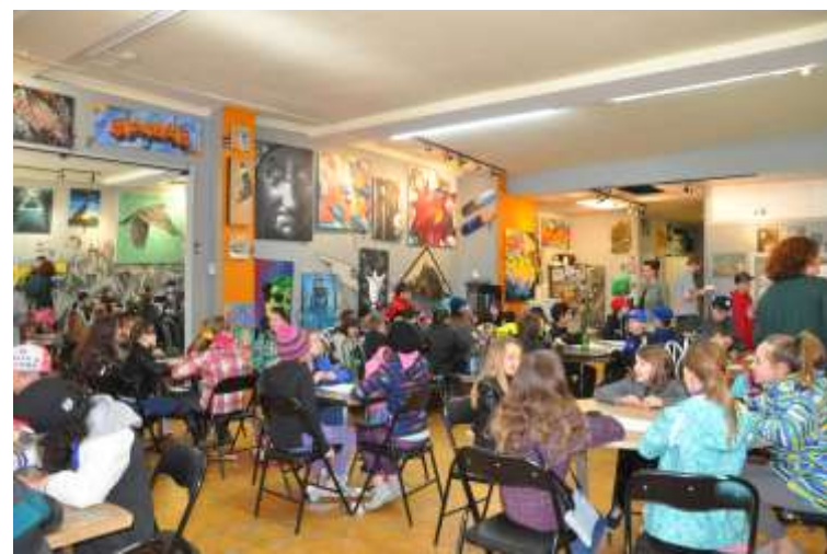
Sortie au Café Graffiti