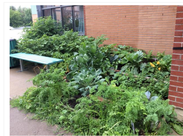
Notre jardin communautaire